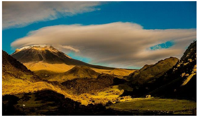
Volcán Tolima, situado en el Parque nacional de Los Nevados