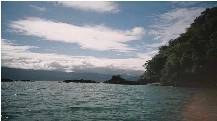
Playas de Nuquí.