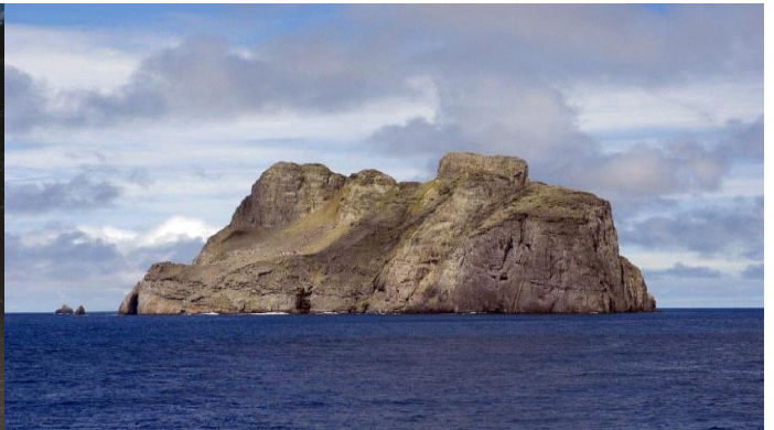
Isla de Malpelo.