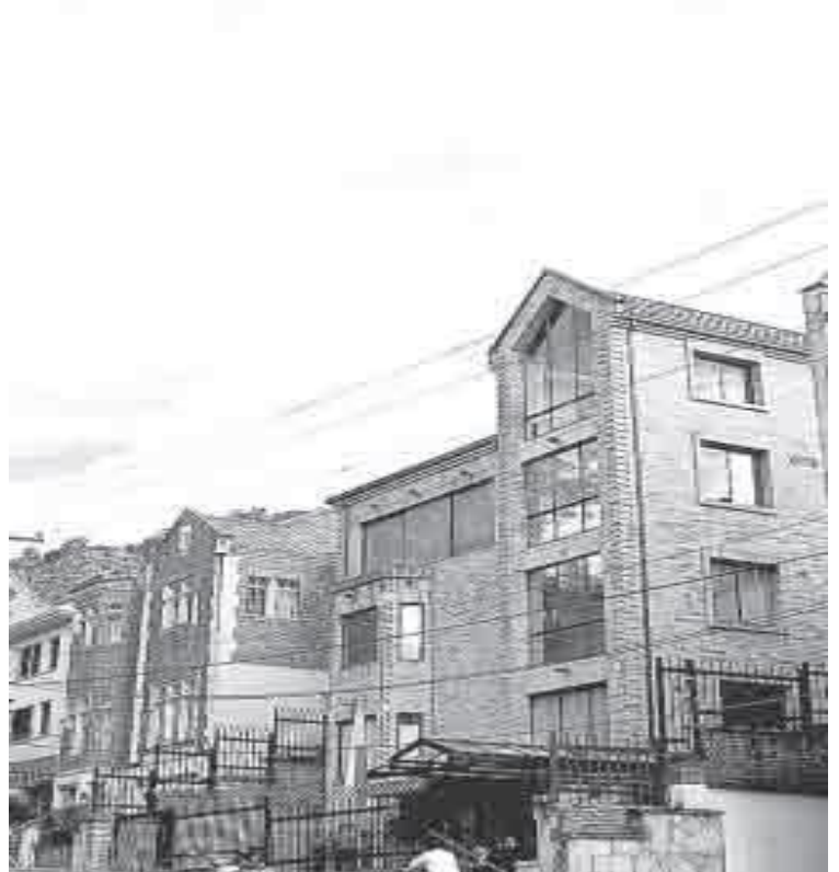
Sede de la Fiscalía en Santafé de Bogotá.