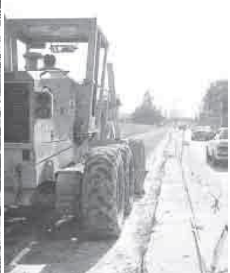
Las obras públicas son planeadas y pagadas por el Estado.