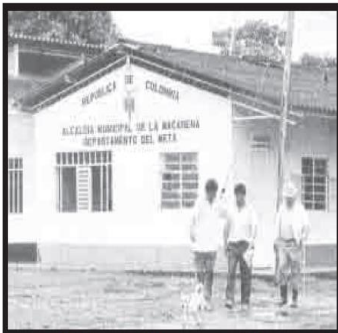
Alcaldía municipal. Departamento del Meta.

La división del poder público en tres ramas no significa que cada rama actúe por su cuenta. Cada una necesita de la otra y deben estar en concordancia.