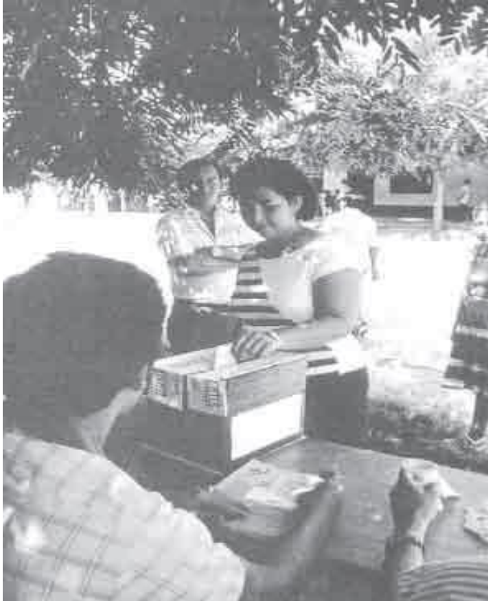
Votación rural en el Tolima.

El Congreso ejerce el control político sobre el gobierno. Le puede pedir explicaciones al presidente sobre las decisiones que ha tomado y puede censurar a los ministros.