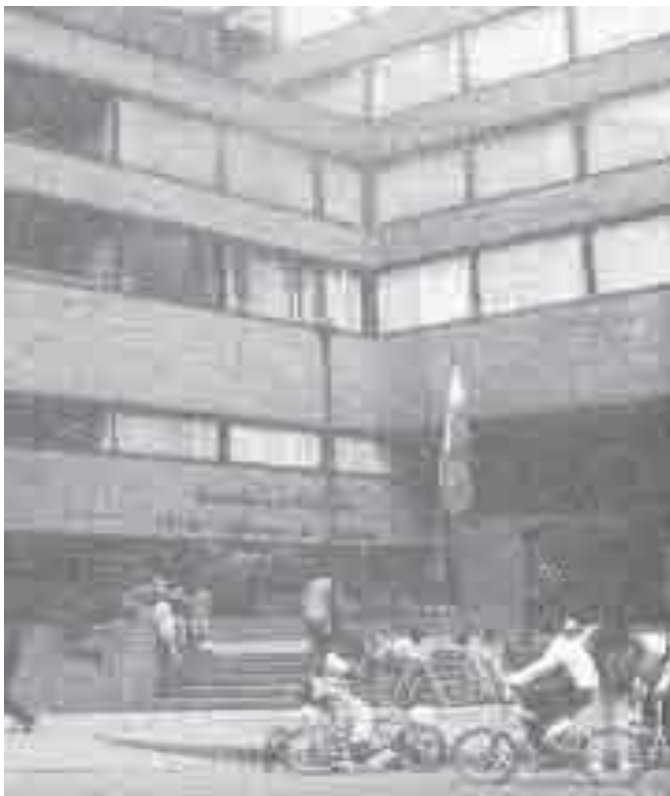
Sede de la Corte Suprema en Santafé de Bogotá.

Además, el Consejo de Estado y los tribunales contenciosos se encargan de revisar que los decretos y demás actos del gobierno (nacional, departamental o municipal) no violen normas superiores, o sea, la ley y la Constitución.