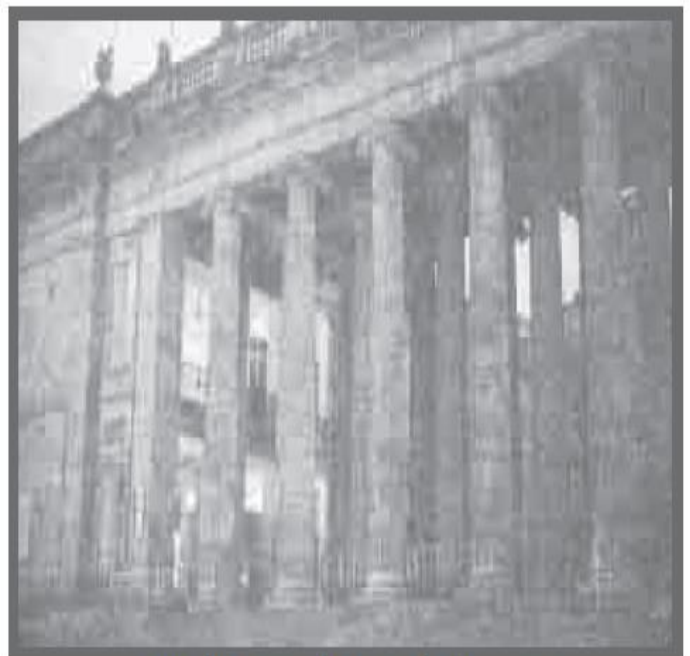
Capitolio Nacional en Santafé de Bogotá.