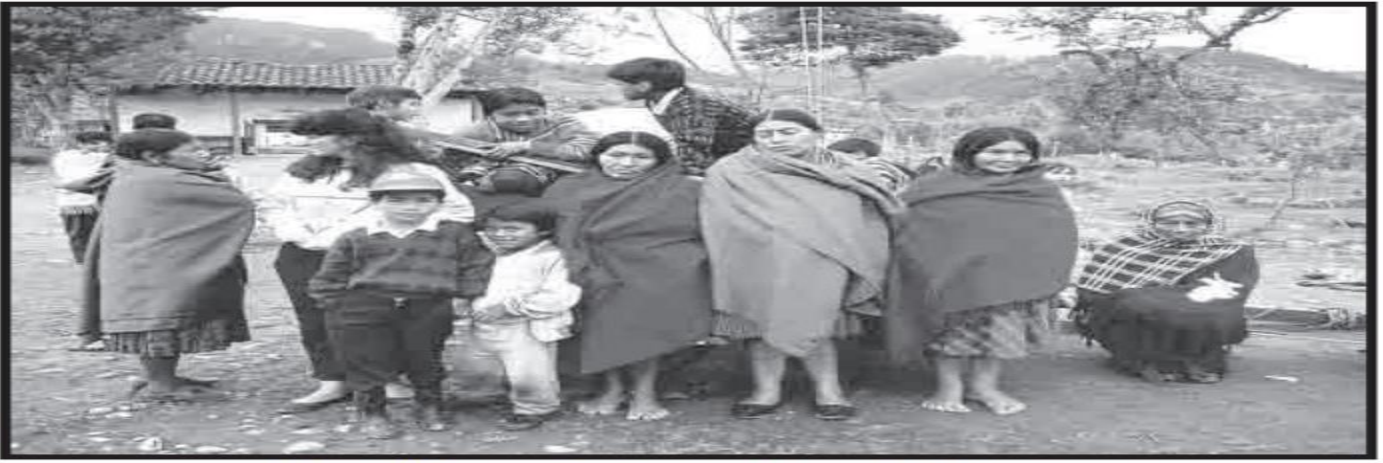
Indígenas del Cauca: las leyes que antes los oprimían, hoy los protegen.

Otro ejemplo es el cambio en las leyes que regulan el derecho al voto. En el siglo pasado, estas normas cambiaron muchas veces. Según una de ellas, sólo podían votar los varones mayores de 21 años que tuvieran propiedades. Según otra, podían ejercer este derecho todos los hombres mayores de edad. Otra exigía como requisito para votar que la persona supiera leer. En ningún caso las mujeres tenían derecho a elegir a sus gobernantes. Cada una de estas leyes sobre el tema del voto respondía a razones diferentes. Cuando cambiaban las razones, también lo hacía la ley.